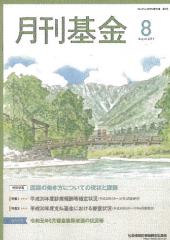
河童橋（長野県） 表紙イラスト 永吉 秀司

標高1,500mの山岳リゾート上高地の河童橋は梓川に架かる木製吊橋。橋からは、梓川の澄みきった流れとともに、3,000m級の西穂高岳、奥穂高岳、明神岳、焼岳などの山々を眺めることができます。